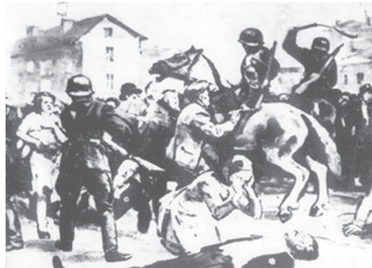
24-майската манифестация 1943 г., организирана от комунистите, в защита на евреите

пък някогашният доблестен журналист на в. "Работническо дело" Исак Гозес казва: