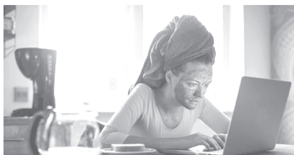
Заседналият начин на живот е сред основните причини за преждевременното състаряване на кожата

Колагенът е протеин, определящ структурата, гъвкавостта и твърдостта на кожата. Човешкото тяло произвежда колаген естествено. Когато той е с високи нива, кожата е по-стегната и гладка. Колагенът предотвратява