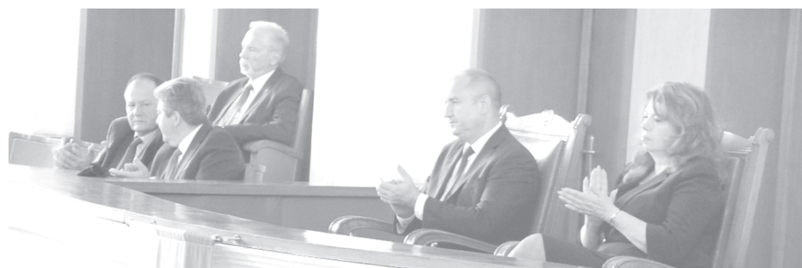
Румен Радев очаква възстановяване на парламентаризма и кабинет с широка парламентарна и обществена подкрепа

България не може да си позволи да пилее повече историческо време, трябва да имаме кабинет с широка парламентарна