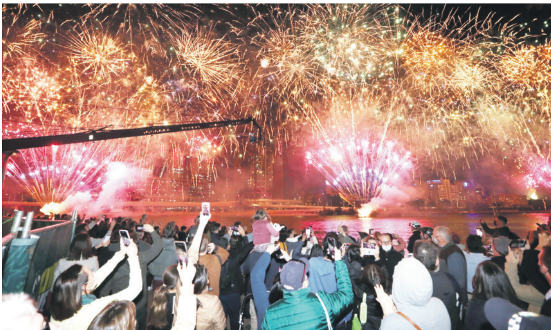
Жители на Бризбън се радват на илюминациите след избирането на града за домакин на Лятната олимпиада през 2032 г.

Австралийският град Бризбън бе избран за домакин на Лятната олимпиада през 2032 г., превръщайки се в третия град в континента-държава, след Мелбърн и Сидни, който ще приеме Летни олимпийски игри.