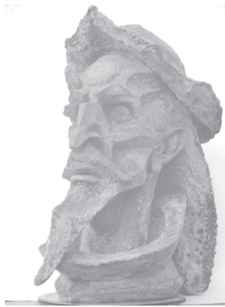
Портрет на Дон Кихот