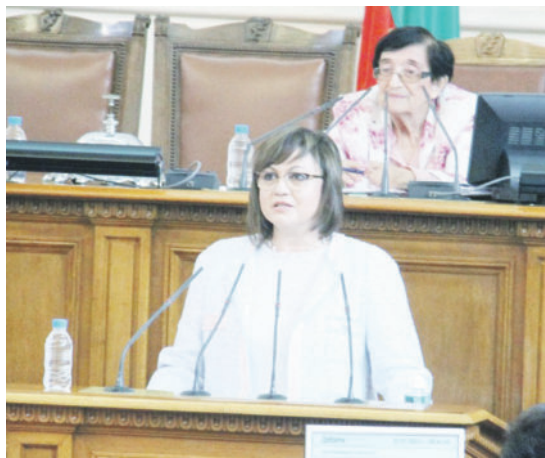
Време е за диалог между държавници, за разум, реализъм и решения за хората, призова Корнелия Нинова

Корнелия Нинова отново заяви готовност БСП да предложи кабинет, ако третият проучвателен мандат попадне при нея. Социалистите ще поканят представители на служебното правителство, но всичко ще е подчинено на четирите приоритета на “БСП за България” - социална политика, здравеопазване, образование и култура, както и икономика.