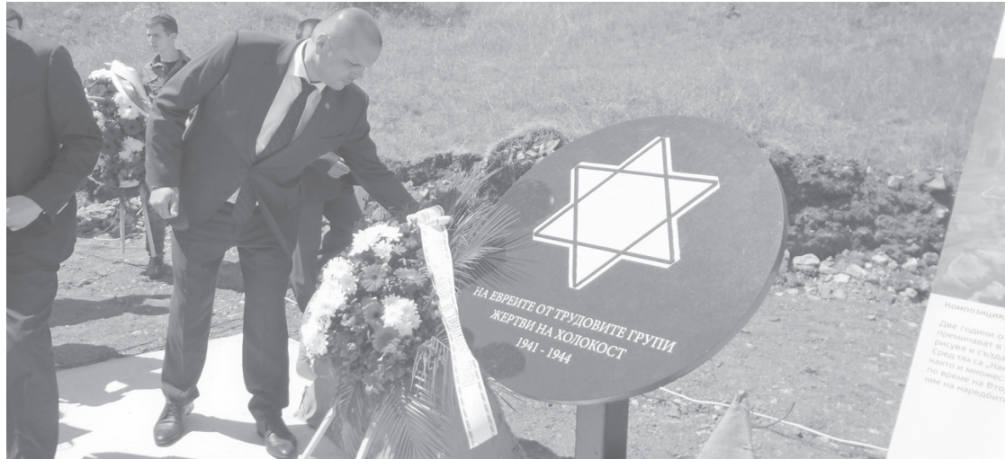
Възпоменателна плоча край Брезник в памет на евреите, полагали принудителен робски труд по време на Холокоста в периода 1941-1944 г. в Първа Трудова дружина в Трънска клисура

2. Спешен апел до турското правителство да приеме тридесет хиляди или повече евреи, които биха напуснали евентуално България, ако им се разреши да сторят това.