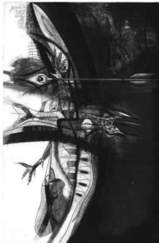
Човекът - природа I, 1987, гравюра на мед (в галерия “Академия”)

по повод 90 години от рождението на акад. Румен Скорчев - живопис и графика, представя галерия “Арте” (от 27 септември до 11 октомври). Вернисажът е на 27 септември от 17,30 до 19,30 ч., научи ДУМА от Гергана Борисова. Експози-