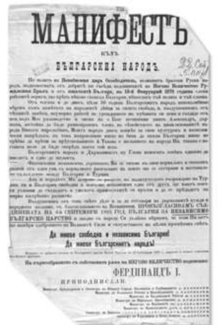
Манифестът на Независимостта