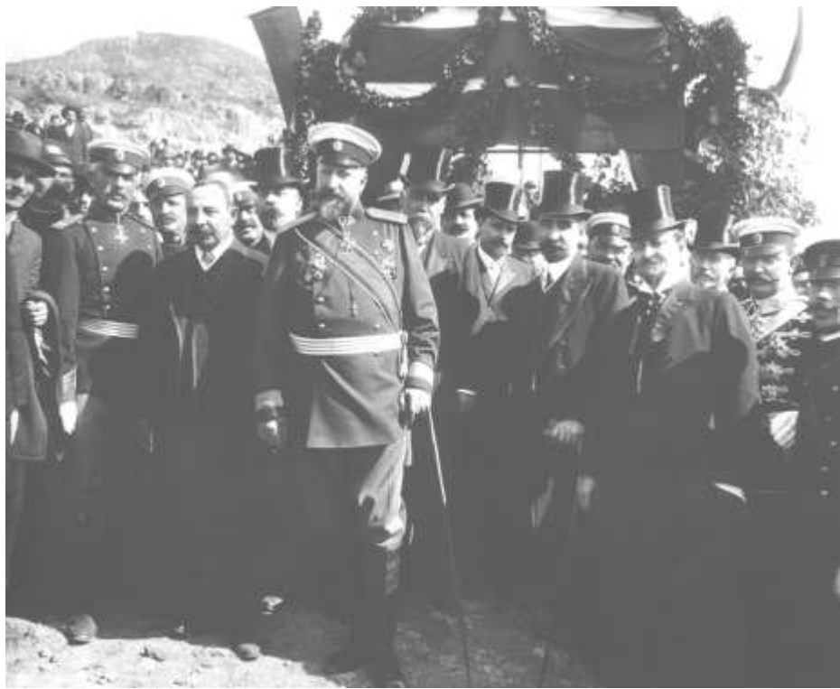
Фердинанд I, министър-председателят Александър Малинов, членове на правителството и генерали при обявяването на Независимостта на България

На 22 септември България чества едно от най-значимите събития от новата си история. На тази дата през 1908 г. българската държава, една от най-старите в Европа, обявява своята независимост. Това става 30 години след Руско-турската война от 1877-1878 г., която приключва с подписания на 3 март 1878 г. Санстефански мирен договор. Така България отново се появява на картата на Европа след петвековно османско владичество.