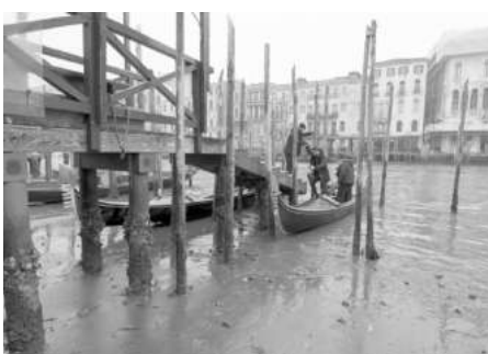
Разочаровани туристи слизат от гондола във Венеция. Някои от каналите са напълно пресъхнали. Въпреки това карнавалният туризъм привлече около 500 000 човека само за месец

Джихадисти убиха най-малко 15 бойци в размирната северна Буркина Фасо. Това се случва само три дни след засада, отнежа живота на други 51 войници. Други все още са в неизвестност.