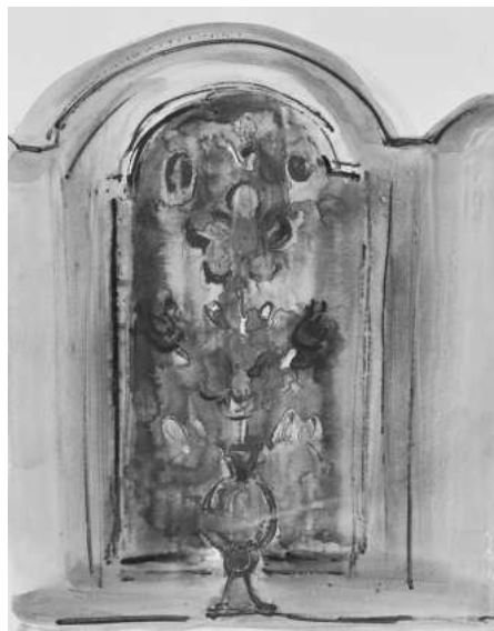
Алафранга, 80-те години на ХХ век, акварел върху хартия

В своето богато и разнообразно творчество и Дечко Узунов е запленил от орнамента и многоцветието, силно изразени в богатите по форма и уникални като колорит народни носии, тъкани, керамика, както и от архитектурата и нейната декоративна украса.