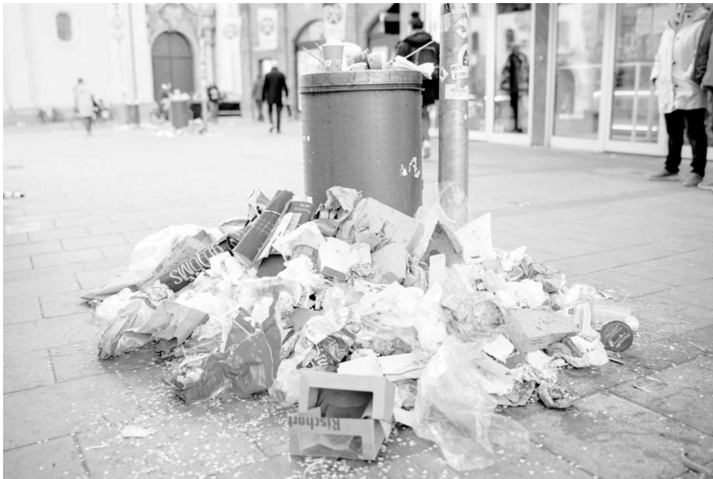
Препълнен контейнер за смет и боклуци около него изненадват гражданите на мюнхенския площад "Мариенплац". Служителите по чистотата в баварската столица провеждат предупредителна стачка с искането за по-високи заплати