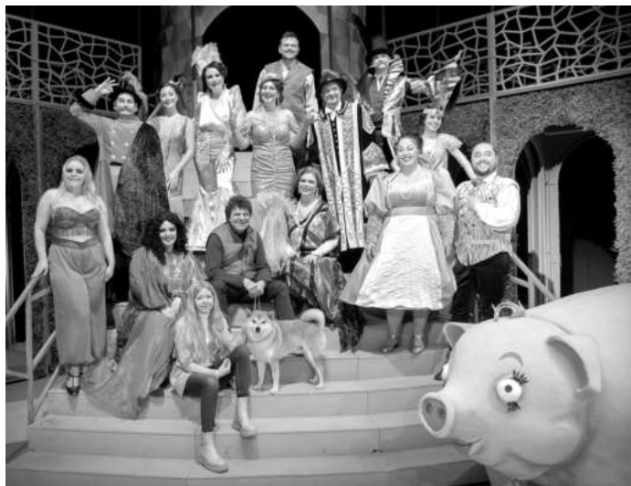
СНИМКА ДО СТАРА ЗАГОРА

В експозицията са подбрани над 20 произведения от фонда на ХГ "Дечко Узунов", филиал на СГХГ.